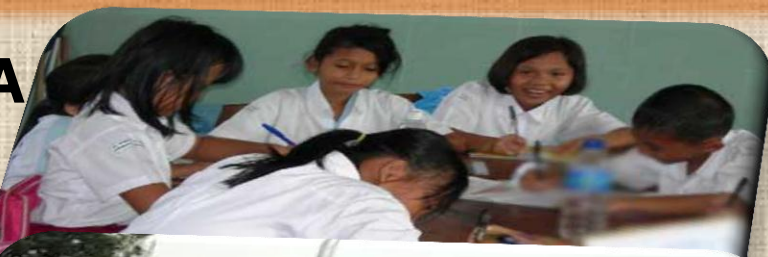
PERILAKU SIAPA ?