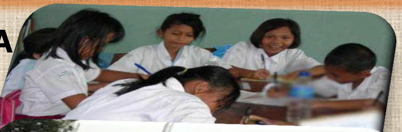
PERILAKU SIAPA ?