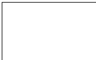
Gambar dokter sedang memeriksa pasien

Misalnya gambar dokter, perawat, dan pasien