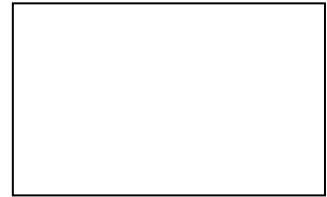
Gambar pasien sedang tidur di tempat tidur